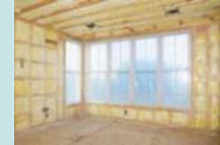
天井・壁・床等 の断熱改修