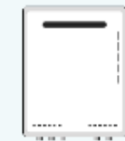
高効率給湯設備 等