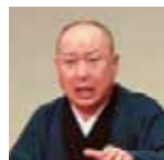
落語家 三遊亭 圓馬