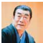
講談師 神田 松鯉