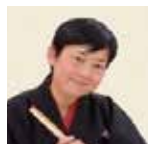
落語家 桂 右團治